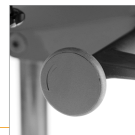
Draaiknop voor de tegendruk instelling van Synchronmechaniek