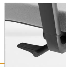
Hendel voor het Synchronmechaniek voorzien van drie mogelijkheden: Actief en/of passief of vast