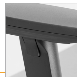
Drukknop voor de hoogte instelling van de draibare armlegger