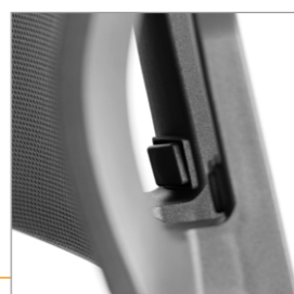
Drukknoppen voor de rughoogte verstelling (inclusief lendensteun verstelling)