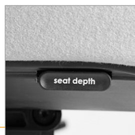
Drukknop voor de zitdiepte verstelling