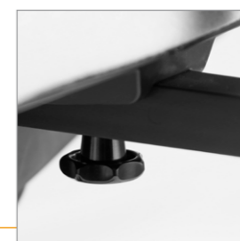
Draaiknop voor breedte-aanpassing